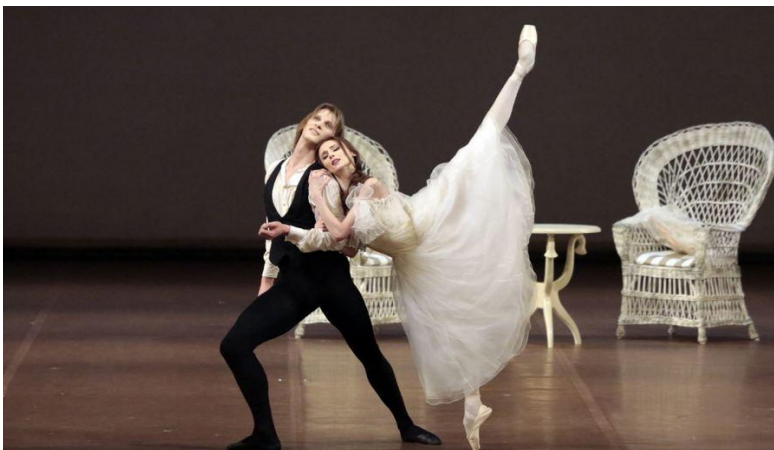
Паганіні та Скрипка