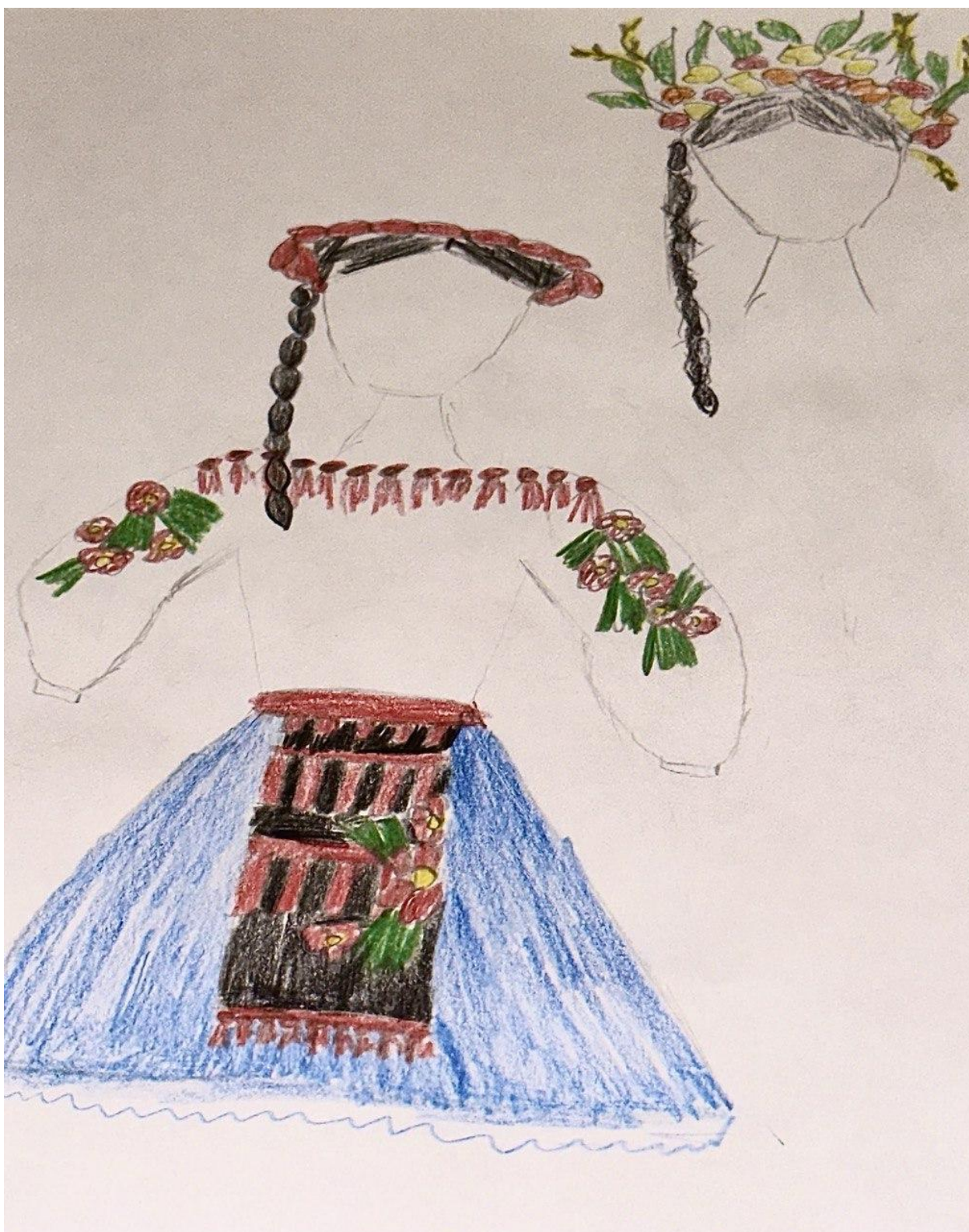
Додаток 2., рис. 1.2

Костюм з першої дії головної героїні: Марічка