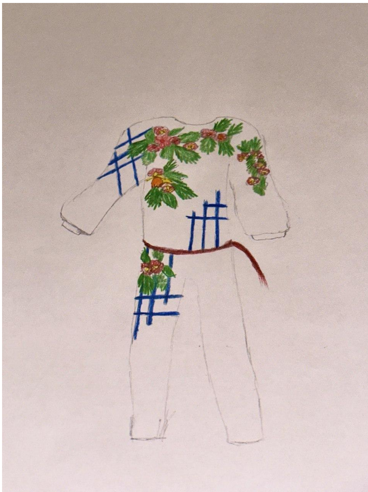
Додаток 1., рис. 1.1