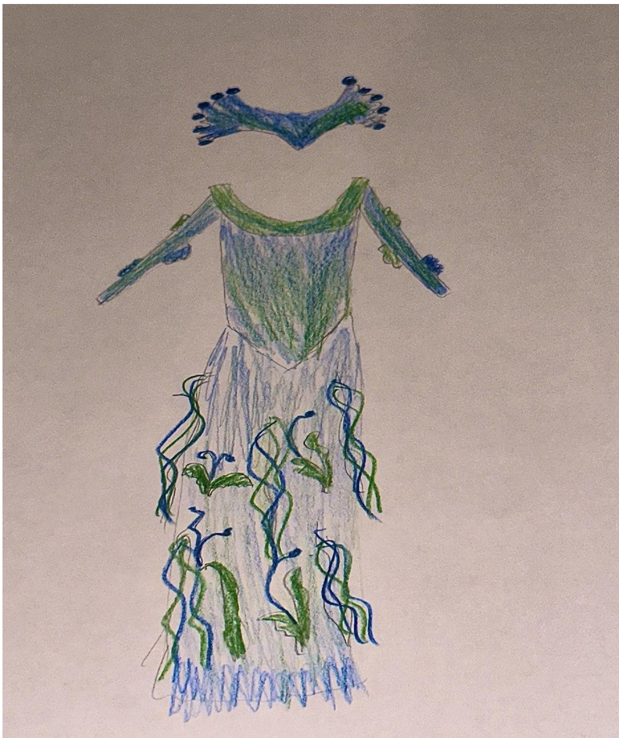
Додаток 4., рис. 1.4