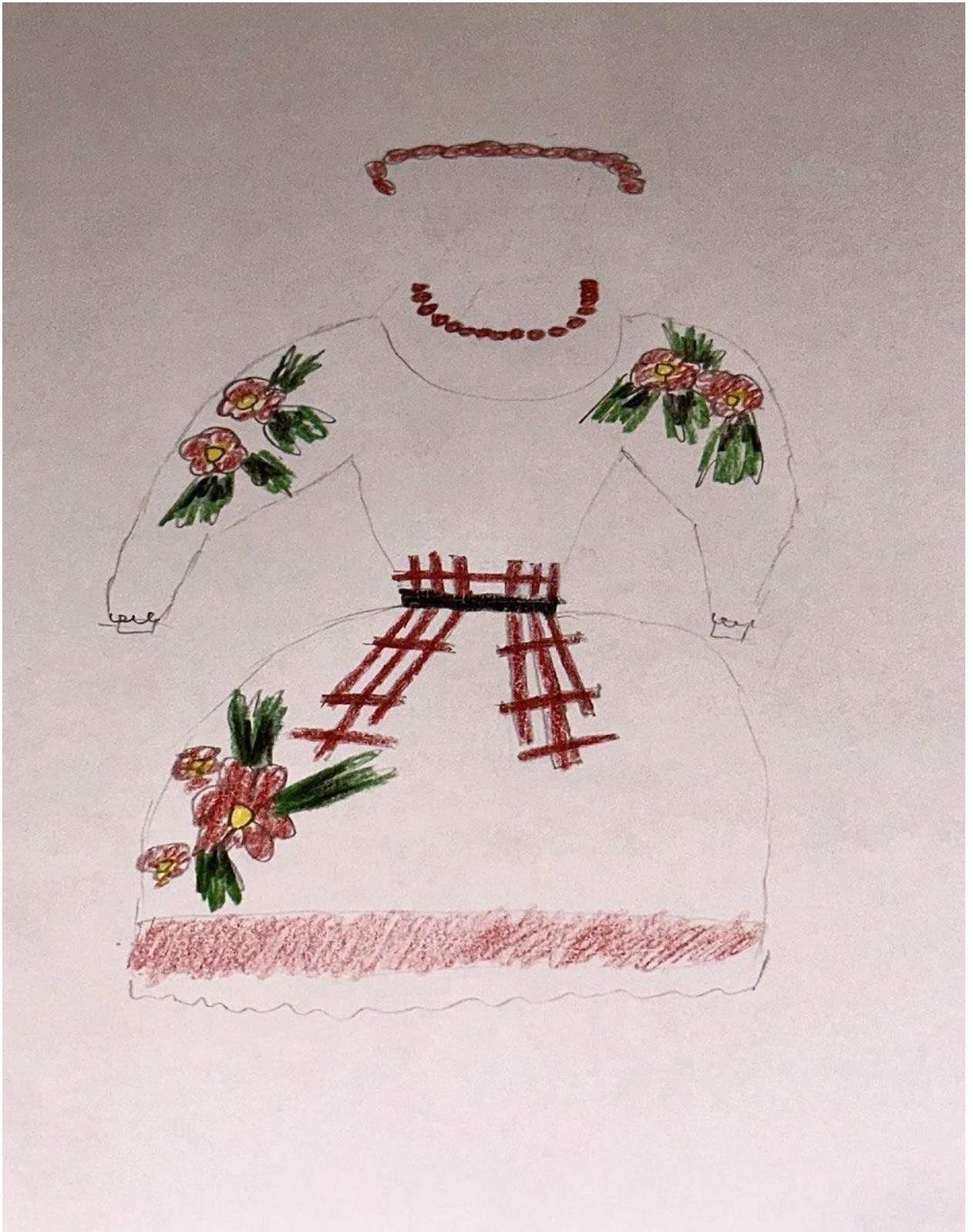
Додаток 3., рис. 1.3

Костюм з другої дії головної героїні: Марічка